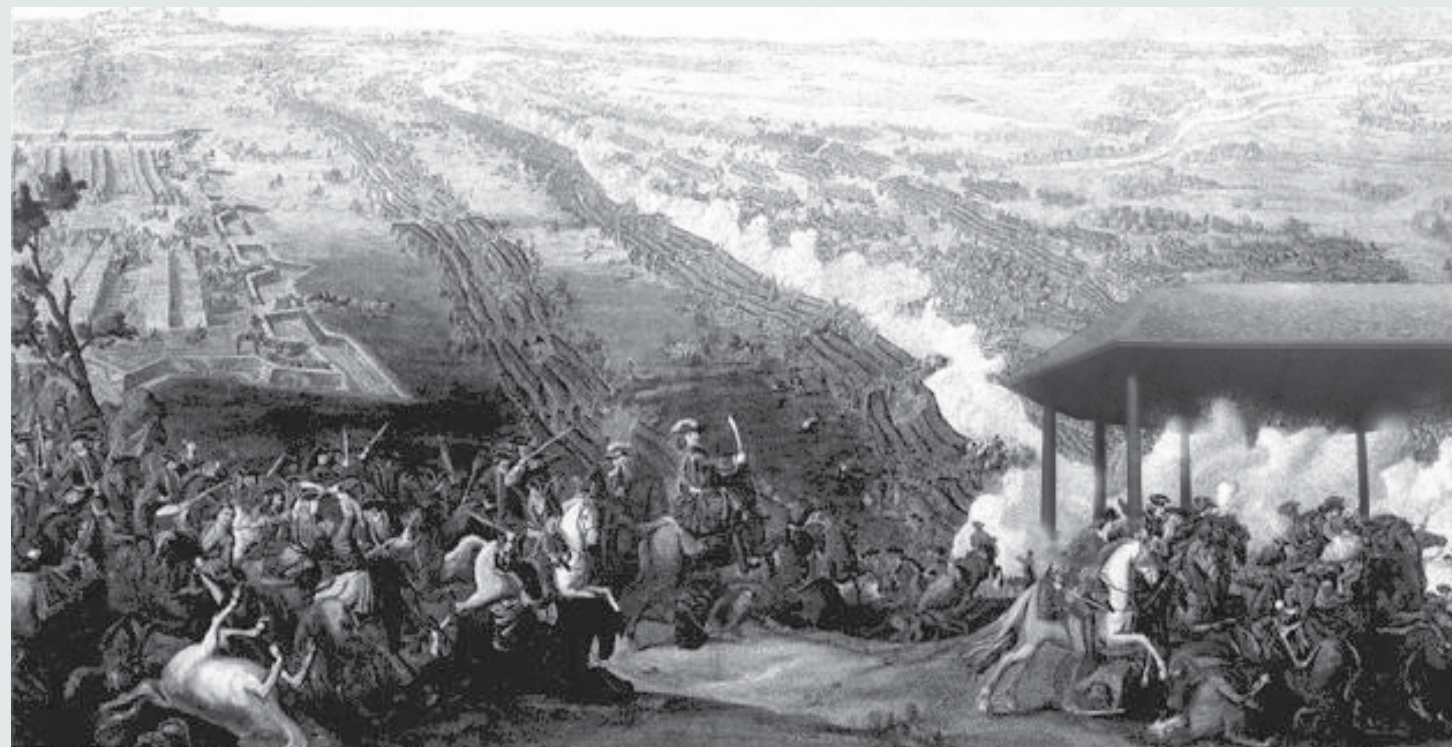
Baserad på Battle of Poltava av Denis Martens the Younger - föreställande slaget vid Poltavas slutskede. Notera spåren i gytjtjan där paviljongen släpats fram av krigshären.